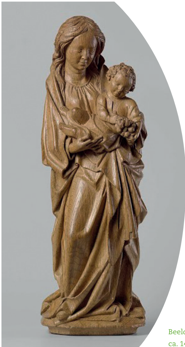
Beeld van Maria met het Christuskind, Adriaen van Wesel, ca. 1470, van eikenhout met sporen van polychromie.

Materiaal voor het vak godsdienst-levensbeschouwing voor de onderbouw (klas 1-2).