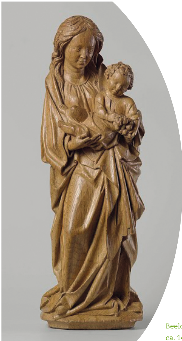
Beeld van Maria met het Christuskind, Adriaen van Wesel, ca. 1470, van eikenhout met sporen van polychromie.

Materiaal voor het vak godsdienst-levensbeschouwing voor de onderbouw (klas 1-2).